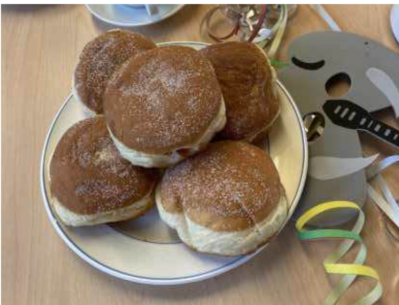
Für das leibliche Wohl war gesorgt.

Dank fleißiger Helferinnen war für das leibliche Wohl wieder bestens gesorgt.