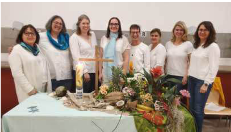
Das Team des Weltgebetstages 2025.

Da dieser Gottesdienst zum Verweilen einladen möchte, fand die Veranstaltung im Schützenheim der Goldbachschützen Baldingen statt. Dort warteten exotische Säfte und Fruchtspieße auf die abendlichen Gottesdienst-Besucherinnen, welche an festlich gedeckten Tischen Platz nahmen: Bunte Blumen, Muscheln und exotische Früchte ließen die Frauen in Gedanken um die halbe Welt reisen.