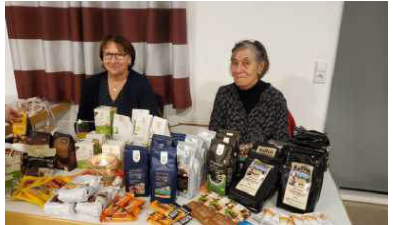
Es wurden Waren vom Eine-Welt-Laden verkauft.

Obwohl die Cookinseln weniger Einwohner als die Stadt Nördlingen haben, entspricht die Meeresfläche des Landes der sechsfachen Landfläche Deutschlands! Dass sich daraus sehr spezielle Lebensumstände hinsichtlich Wirtschaft, Bildung, Bevölkerungsversorgung etc. ergeben zeigte das Baldinger WGT-Team eindrucksvoll durch einen Vortrag und mehrere Interviews mit fiktiven Bewohnern auf.