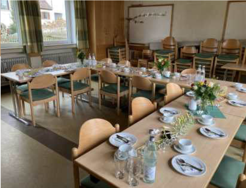
Die Tische waren festlich dekoriert.

Alle 4 Monate wird ein Geburtstagskaffee angeboten. Am 25. Februar folgten diesmal 13 Geburtstagskinder der Einladung und kamen um 15.00 Uhr ins Gemeindehaus von Nähermemmingen.