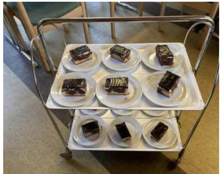
Auch Kuchen gab es reichlich.

An dieser Stelle meinen herzlichen Dank an Frau Egetenmeier, die den Kuchen, die Krapfen und alles, was sonst für die Kaffeerunde nötig ist, besorgt hat.