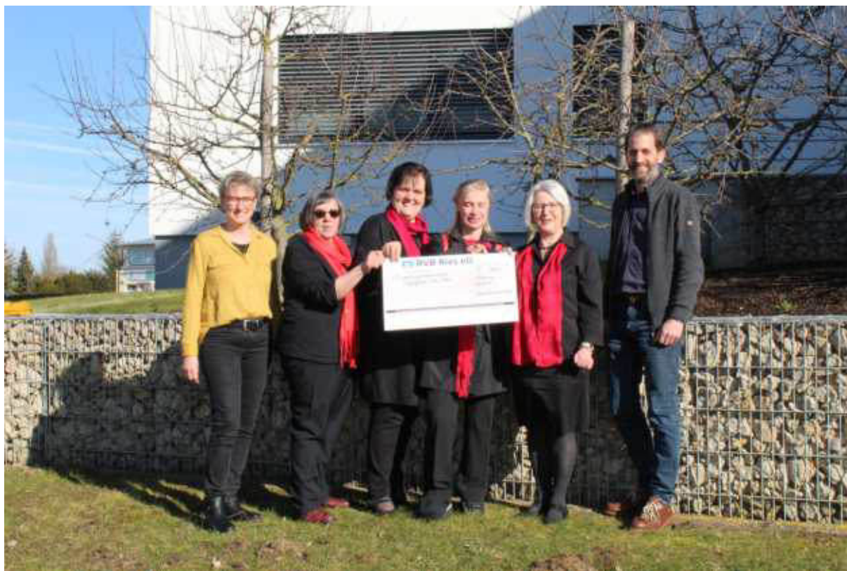
Ein großzügiger Scheck wurde von den Dekanatsfrauen aus dem Donau-Ries übergeben.

Die gemeinsame Veranstaltung der Dekanatsfrauen im neuen evangelischen Dekanat Donau-Ries ist gelungen: Das fränkische Frauenkabarett „Avantgardinen“ brachte die Hainsfarther Mehrzweckhalle zum Kochen. Rund 400 Gäste, darunter auch etliche Männer, erlebten einen fulminanten Auftritt der Kabarett-Damen. Die Darbietungen der Gruppe wurden immer wieder von Szenenapplaus unterbrochen und von rhythmischem Klatschen begleitet. Als Coup erwies sich die Bewirtung durch den evangelischen Männerverein „Mann trifft sich“ aus Hainsfarth.