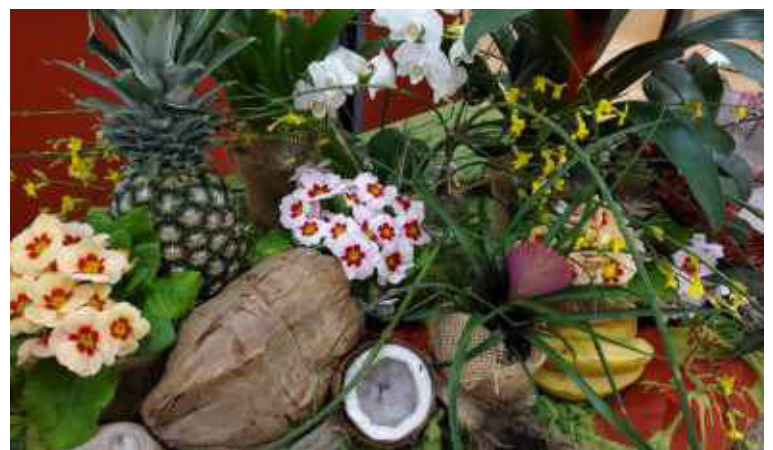
Auch die Vielfalt an Früchten ist in dem Land sehr groß.

Die Zuhörerinnen wurden in die Lebenswelt der Frauen auf den Cookinseln mitgenommen und erfuhren viel über die positive Lebenseinstellung der dortigen Bewohner, die sich auch in deren Traditionen spiegelt. Auch die vielfältigen Beziehungen zu Neuseeland wurden erklärt: die Ureinwohner der Cookinseln entdeckten einst Neuseeland und bevölkerten es. Sie sind der Ursprung der heute auf Neuseeland lebenden Maori (wie man die Ureinwohner sowohl auf den Cookinseln als auch in Neuseeland nennt). Heutzutage zieht es junge Leute v.a. zum Studium ins pazifische Ausland. Politisch werden die Cookinseln heutzutage von Neuseeland vertreten, sie sind „assoziiert“.